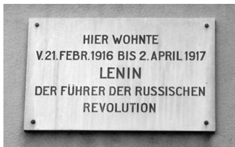
Мемориальная доска на доме № 14 по Шпигельгассе в Цюрихе, где жил В. И. Ленин

доме до 2 апреля (20 марта) 1917 года. Съехал с квартиры, когда все уже было улажено, перед самым отъездом. Но немцы неожиданно переносят сроки и сообщают ленинскому посреднику Фрицу Платтену, что поезд сможет отправиться только 9 апреля. Почему это произошло?