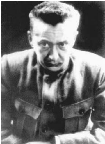
А. Ф. Керенский.

Его вклад в разрушение России поистине огромен и до сих пор по достоинству не оценен