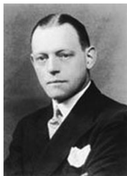
Британский агент Освальд Рейнер, убийца Распутина

Откуда же доблестные англичане, спустя столько лет, узнали о старой операции своих собственных спецслужб? Совершенно