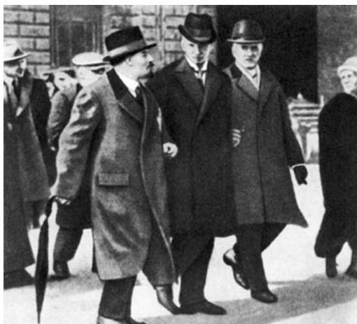
Ленин (с зонтом в руке) в Стокгольме по пути в Россию