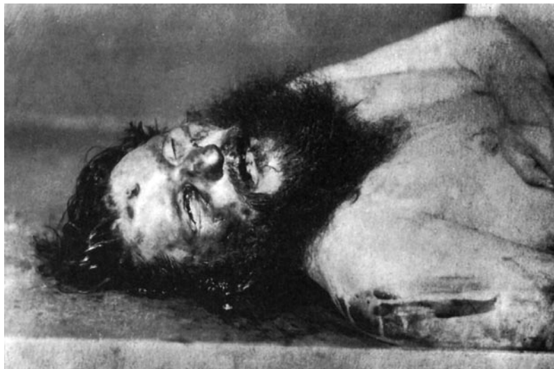
Труп Распутина. На лбу пулевое отверстие, о котором «забыли» его убийцы