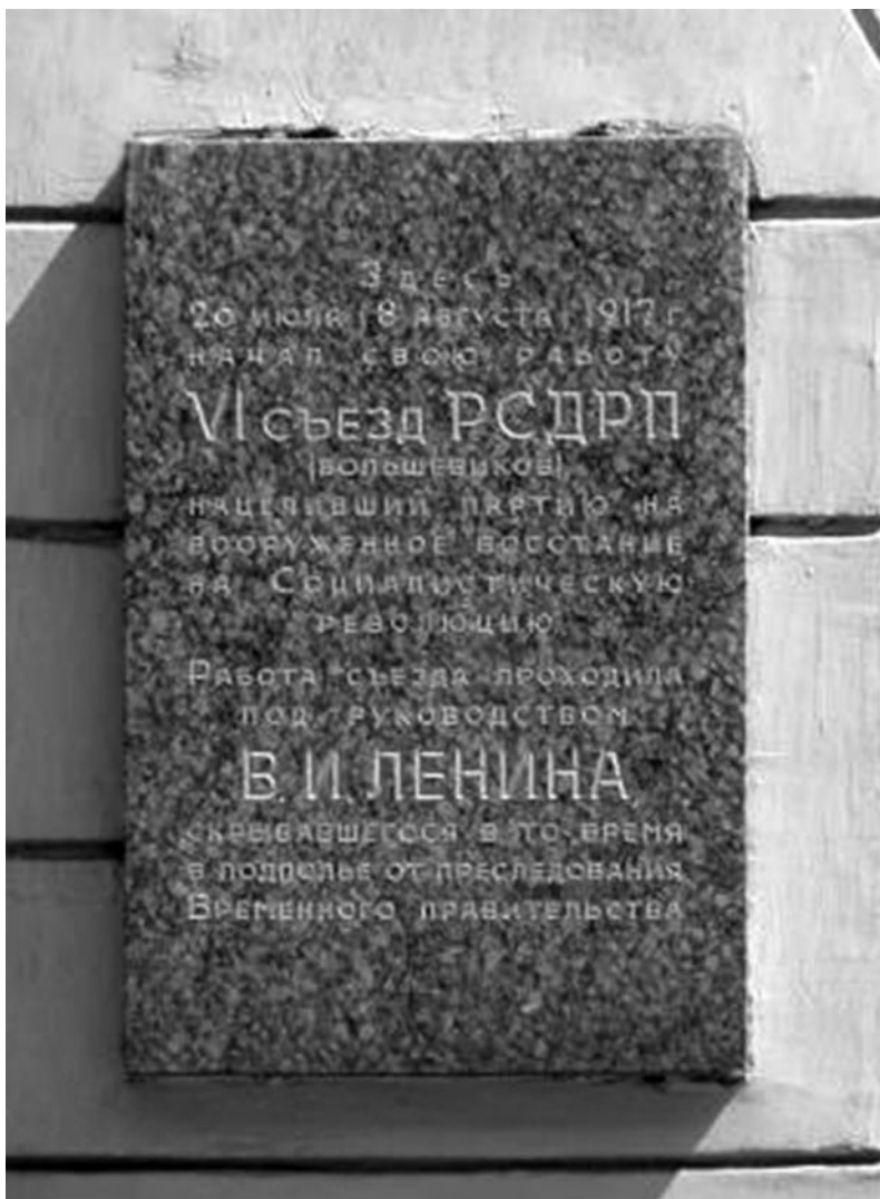
Мемориальная доска на доме № 37 по Большому Сампсониевскому проспекту Санкт-Петербурга, где проходили первые восемь заседаний VI съезда РСДРП(б)